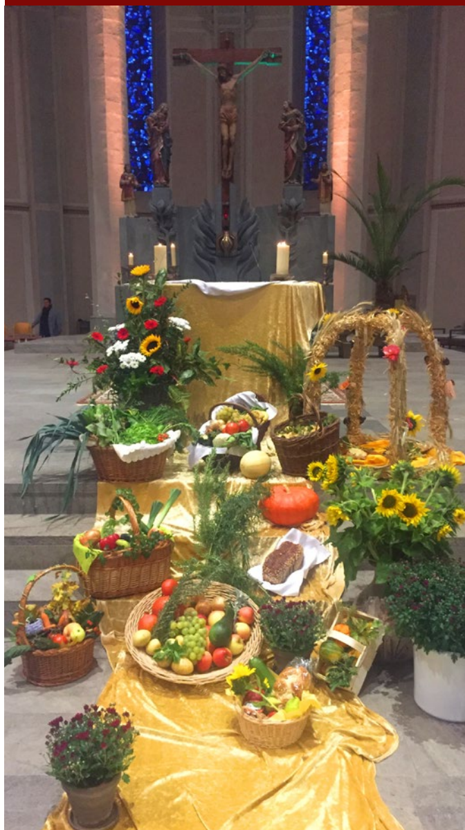
Bild-Nachlese zum Erntedankfest in St. Georg Niederwerth und St. Marzellinus und Petrus, Vallendar