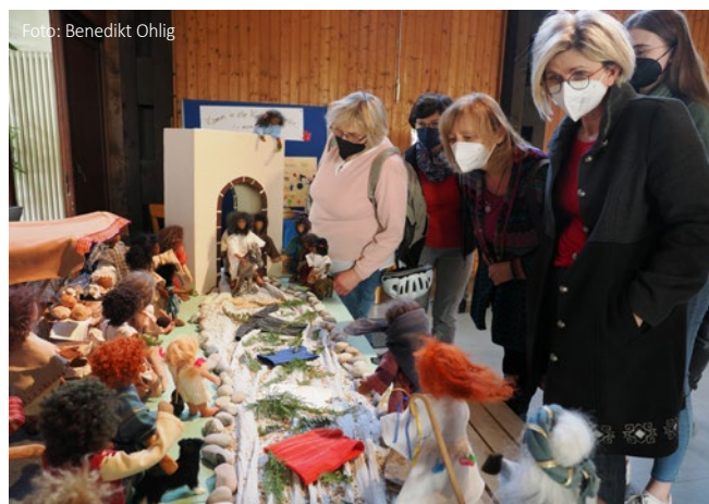
Ostergarten in der Kreuzkirche: Jesus zieht in Jerusalem ein

“ Ich kämpfe nicht länger gegen den Sturm in meinem Leben, ich tanze mit ihm. Er lehrt mich Schritte, die ich ohne ihn nicht meistern würde. Fatih Faran