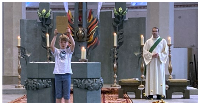
Das Evangelium „hochleben lassen“

Sichtlich Freude hatten die Kinder an der praktischen Umsetzung des Evangeliums vom Sämann, dessen Körner auf verschiedenen Boden fallen. Die konkrete Übertragung der „Hoffungskörner“ ins eigene Leben, war nicht nur für die Kinder interessant, sondern berührte auch die teilnehmenden Erwachsenen.