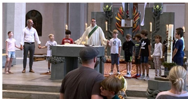
Gemeinschaft untereinander und mit Jesus tut gut