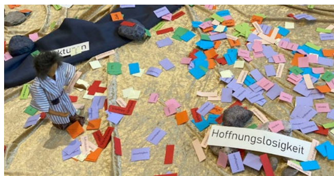
„Vertrauen“, „Zufriedenheit“, „Gerechtigkeit“, „Liebe“, „Frieden“