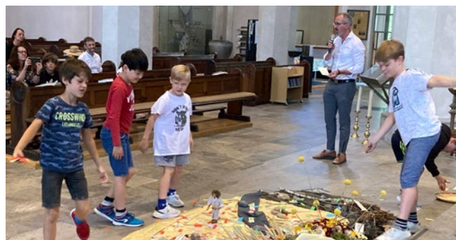
Die „Hoffungs“-Körner werden ausgesät: „Zuneigung“, „Glück“,